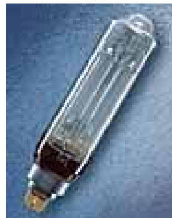
Рис. 2 Лампа SOX-E

Натриевые лампы низкого давления SOX-E имеют световую отдачу до 173 лм/Вт. Их монохроматический желтый свет (линия натрия 590 нм) обеспечивает контрастную видимость объектов даже в густом тумане и легкой дымке. Монохроматический желтый