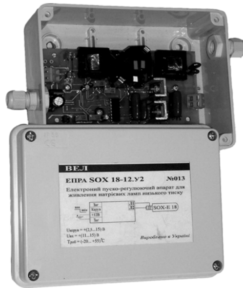
Рис. 3 Пускорегулирующий аппарат ЭПРА SOX-E

Световой поток практически не зависит от температуры окружающей среды (вне светильника).