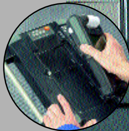
Съемный управляющий модуль