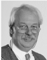
Детлеф Хиггелке, Глава Академии Testo AG

... потому что они знают что они делают. Мы предлагаем нашу поддержку с помощью, ориентированных на разные отрасли тренингов о процедурах проведения