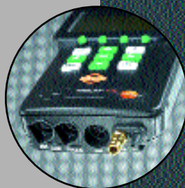
Прочные соединения для измерения давления и скорости потока