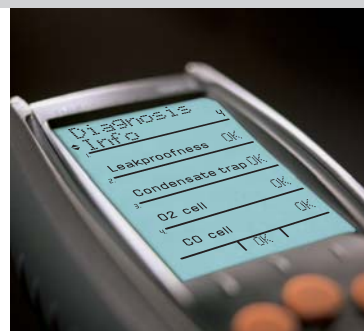
Всегда надежен: благодаря функции самодиагностики и отображения состояния изношенности частей (деталей)