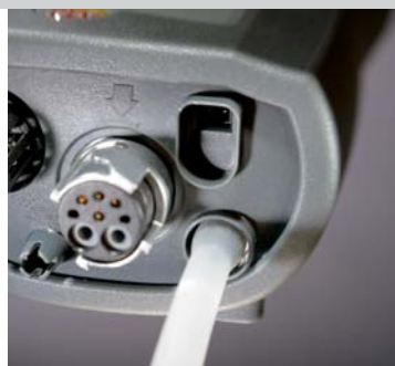
Измерение дифференциального давления до 200 мбар